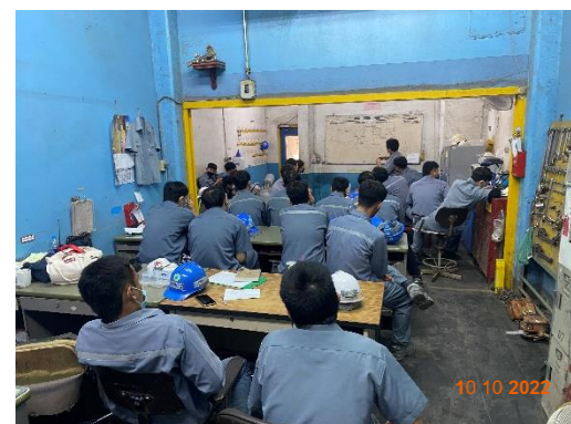
รูปที่ 2-27 การจัดอบรมพนักงานขับรถบรรทุกแร่