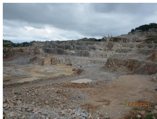
รูปที่ 2-23 ลักษณะการทำเหมืองแบบขั้นบันได