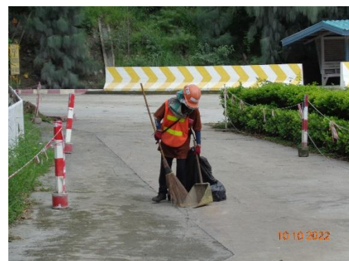
รูปที่ 2-21 พนักงานประจำเพื่อทำความสะอาดลานซีเมนต์ บริเวณโรงงานปูนซีเมนต์