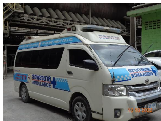
รูปที่ 2-34 ห้องพยาบาลและรถพยาบาลฉุกเฉิน