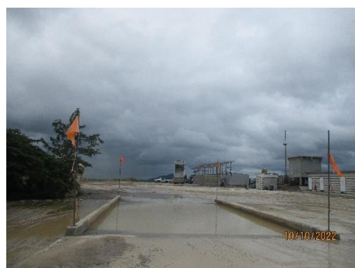
รูปที่ 2-17 บริเวณสำหรับการทำความสะอาดเศษดิน เศษโคลนที่ติดตามรถบรรทุกแร่