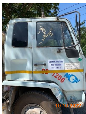
รูปที่ 2-28 เบอร์โทรศัพท์ หรือรายละเอียดที่สามารถแจ้ง ขอร้องเรียนที่เห็นชัดเจน ข้างรถบรรทุกแร่ของโครงการ