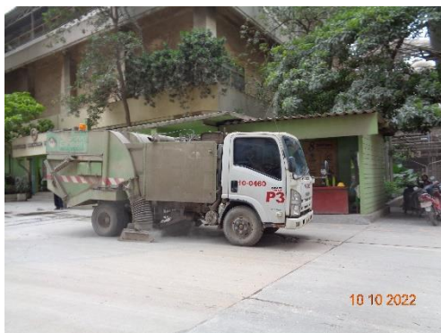
รูปที่ 2-14 รถดูดฝุ่นทำความสะอาดฝุ่น บริเวณลานหน้าประตู 3