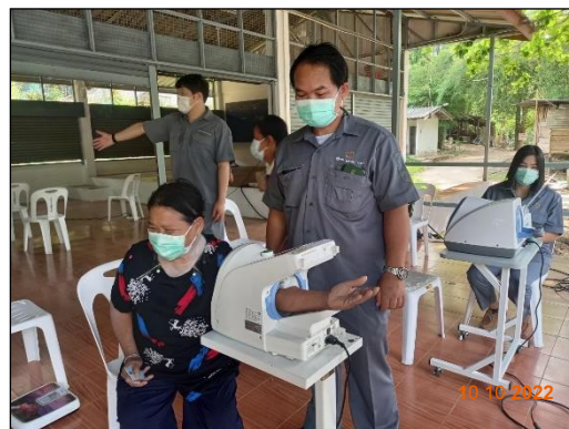
รูปที่ 2-32 การออกหน่วยแพทย์เคลื่อนที่ และการตรวจสุขภาพ