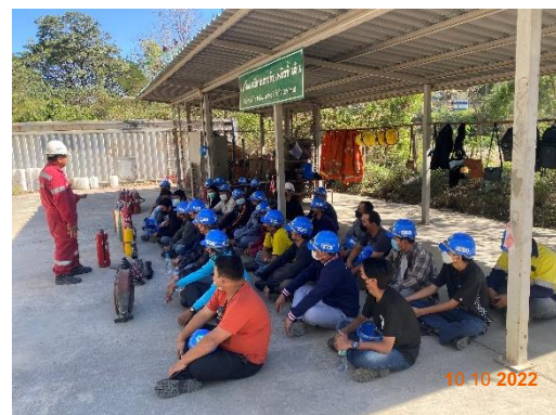
รูปที่ 2-33 การอบรมแก่พนักงานและผู้ควบคุมการ ดำเนินงาน ในเรื่องอาชีวอนามัยและความปลอดภัย