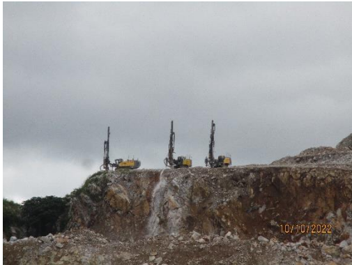
รูปที่ 2-7 เครื่องเจาะระเบิดที่มีระบบ Cyclone และถุงกรอง

โครงการเหมืองแร่หินอุตสาหกรรมชนิดหินปูน เพื่ออุตสาหกรรมปูนซีเมนต์ สำหรับแปลงคำขอประทานบัตรที่ 12/2556 ร่วมแผนผังโครงการทำเหมืองเดียวกัน กับคำขอประทานบัตรที่ 13/2556, คำขอประทานบัตรที่ 14/2556, คำขอประทานบัตรที่ 15/2556, คำขอประทานบัตรที่ 16/2556 และคำขอประทานบัตรที่ 17/2556 และประทานบัตรที่ 27340/14390 ประทานบัตรที่ 27341/14391 และประทานบัตรที่ 27348/14392 ของบริษัท ทีพีโอ โพลีน จำกัด (มหาชน) ระหว่างเดือนกรกฎาคม-ธันวาคม พ.ศ. 2565