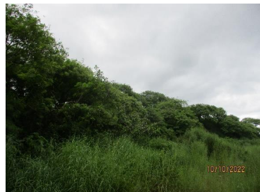
รูปที่ 2-6 การปลูกต้นไม้ทรงสูง ตามแนวเส้นทางขนส่งแร่ บริเวณพื้นที่โครงการ