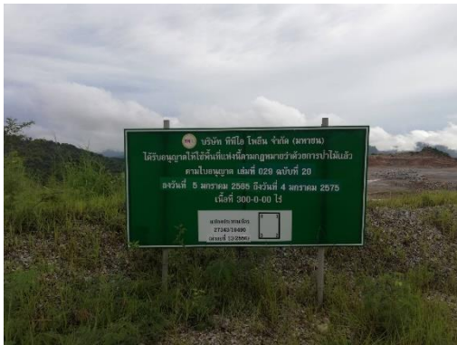
รูปที่ 2-3 ป้ายแสดงแผนผังพื้นที่โครงการ