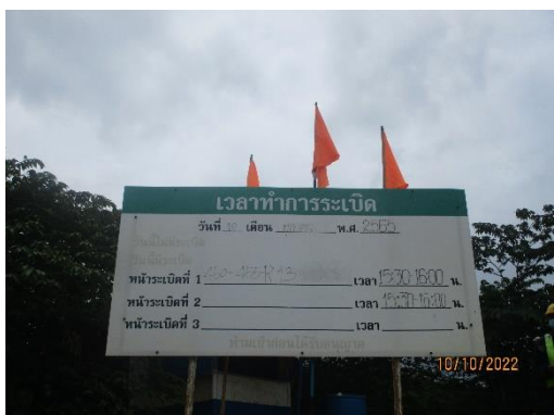
รูปที่ 2-22 ป้ายแจ้งวัน-เวลาระเบิด