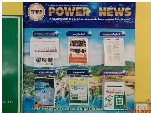
รูปที่ 2-31 บอร์ดประชาสัมพันธ์ แสดงเกี่ยวกับข้อมูลโครงการ

โครงการเหมืองแร่หินอุตสาหกรรมชนิดหินปูน เพื่ออุตสาหกรรมปูนซีเมนต์ สำหรับแปลงคำขอประทานบัตรที่ 12/2556 ร่วมแผนผังโครงการทำเหมืองเดียวกัน กับคำขอประทานบัตรที่ 13/2556, คำขอประทานบัตรที่ 14/2556, คำขอประทานบัตรที่ 15/2556, คำขอประทานบัตรที่ 16/2556 และคำขอประทานบัตรที่ 17/2556 และประทานบัตรที่ 27340/14390 ประทานบัตรที่ 27341/14391 และประทานบัตรที่ 27348/14392 ของบริษัท ทีพีโอ โพลีน จำกัด (มหาชน) ระหว่างเดือนกรกฎาคม-ธันวาคม พ.ศ. 2565