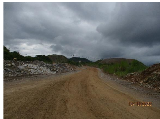
รูปที่ 2-15 ใช้ประโยชน์มูลดินในการปรับปรุง ไหล่ทาง และเส้นทางบริเวณหน้าเหมือง