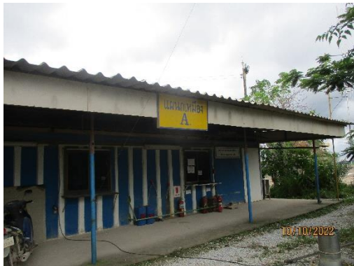
รูปที่ 2-24 สถานที่เก็บเครื่องมือและอุปกรณ์ บริเวณพื้นที่โครงการ

โครงการเหมืองแร่หินอุตสาหกรรมชนิดหินปูน เพื่ออุตสาหกรรมปูนซีเมนต์ สำหรับแปลงคำขอประทานบัตรที่ 12/2556 ร่วมแผนผังโครงการทำเหมืองเดียวกัน กับคำขอประทานบัตรที่ 13/2556, คำขอประทานบัตรที่ 14/2556, คำขอประทานบัตรที่ 15/2556, คำขอประทานบัตรที่ 16/2556 และคำขอประทานบัตรที่ 17/2556 และประทานบัตรที่ 27340/14390 ประทานบัตรที่ 27341/14391 และประทานบัตรที่ 27348/14392 ของบริษัท ทีพีโอ โพลีน จำกัด (มหาชน) ระหว่างเดือนกรกฎาคม-ธันวาคม พ.ศ. 2565