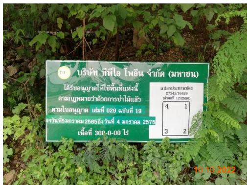
รูปที่ 2-5 ป้ายแสดงรายละเอียดของแปลงประทานบัตร บริเวณพื้นที่โครงการ