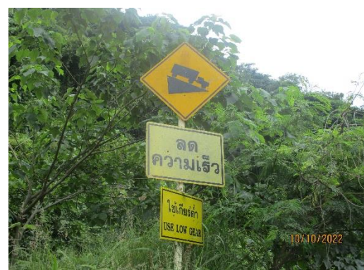
รูปที่ 2-29 ป้ายสัญญาณเตือนภัย บริเวณพื้นที่โครงการ