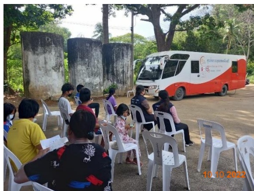
รูปที่ 2-32 (ต่อ) การออกหน่วยแพทย์เคลื่อนที่ และการตรวจสุขภาพ