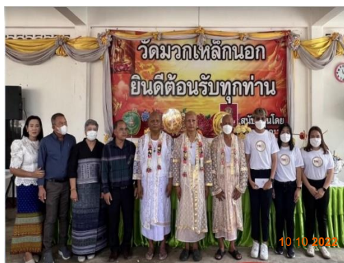
รูปที่ 2-30 การสนับสนุนกิจกรรมชุมชน