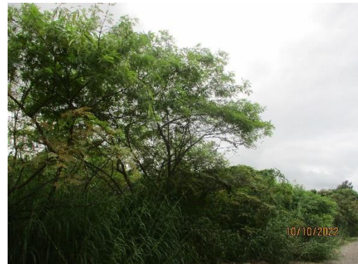
รูปที่ 2-13 การปลูกไม้ยืนต้นโตเร็วประจำถิ่น บริเวณขอบเขตพื้นที่โรงโม่บด และย่อยหิน