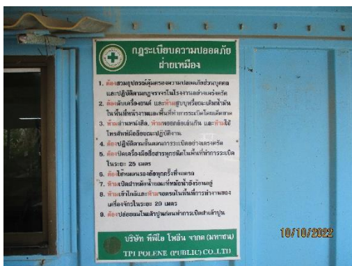
รูปที่ 2-26 ป้ายประกาศด้านความปลอดภัย และข่าวสารต่างๆ ในพื้นที่เหมือง