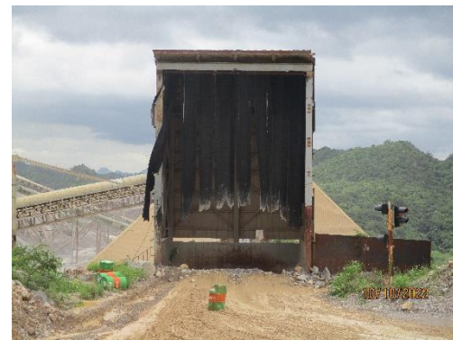
รูปที่ 2-10 เครื่องย่อยหินปูน (Limestone Crusher)