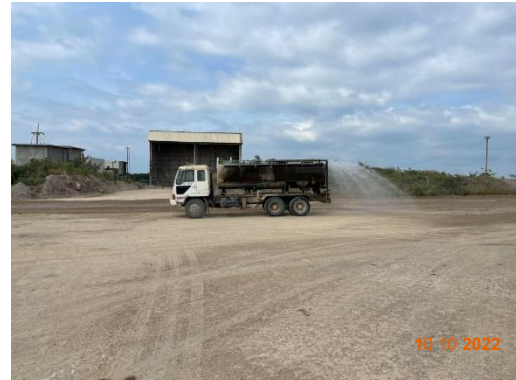
รูปที่ 2-8 การฉีดพรมน้ำ บริเวณพื้นที่โครงการ