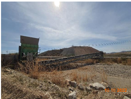
รูปที่ 2-9 โรงย่อยหินแบบ Semi Mobile Crusher