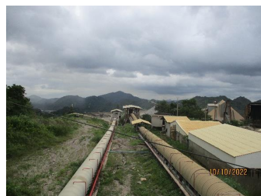
รูปที่ 2-11 ระบบ Bag Filter จุดถ่ายโอนต่างๆของสายพานลำเลียง