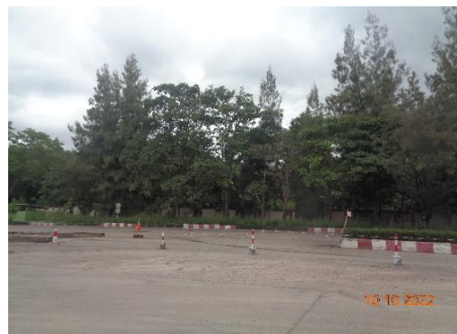
รูปที่ 2-19 ลานคอนกรีตเสริมเหล็ก บริเวณโรงงานปูนซีเมนต์และลานจอดรถบรรทุก