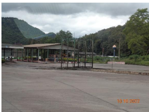
รูปที่ 2-20 พื้นที่สำหรับจอดรถบรรทุก รับ-ส่งวัตถุดิบในการผลิตซีเมนต์