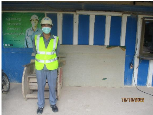
รูปที่ 2-12 การสวมใส่อุปกรณ์ป้องกันอันตราย ส่วนบุคคลของพนักงาน

โครงการเหมืองแร่หินอุตสาหกรรมชนิดหินปูน เพื่ออุตสาหกรรมปูนซีเมนต์ สำหรับแปลงคำขอประทานบัตรที่ 12/2556 ร่วมแผนผังโครงการทำเหมืองเดียวกัน กับคำขอประทานบัตรที่ 13/2556, คำขอประทานบัตรที่ 14/2556, คำขอประทานบัตรที่ 15/2556, คำขอประทานบัตรที่ 16/2556 และคำขอประทานบัตรที่ 17/2556 และประทานบัตรที่ 27340/14390 ประทานบัตรที่ 27341/14391 และประทานบัตรที่ 27348/14392 ของบริษัท ทีพีโอ โพลีน จำกัด (มหาชน) ระหว่างเดือนกรกฎาคม-ธันวาคม พ.ศ. 2565