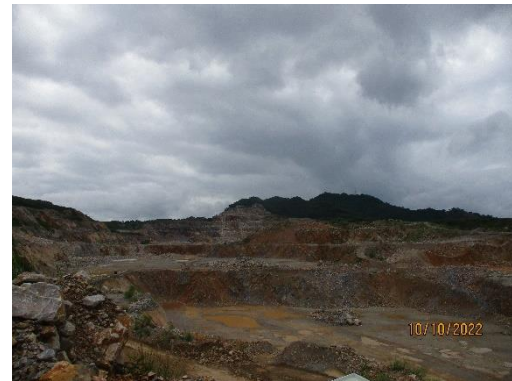
รูปที่ 2-4 ลักษณะการทำเหมืองแบบชันบันได เหมืองแร่หินปูน