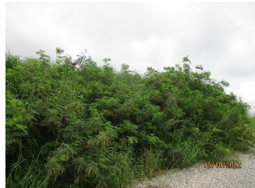
รูปที่ 2-25 เขตพื้นที่กั้นชน (Buffer zone)