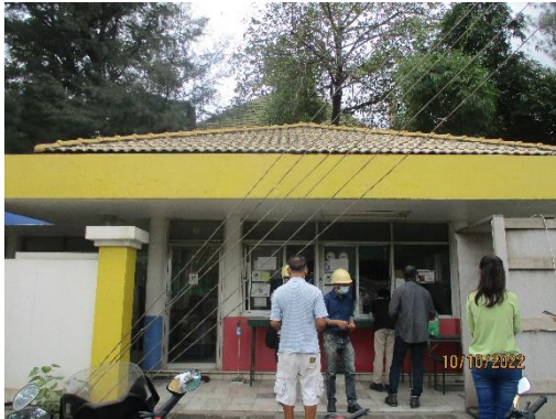
รูปที่ 2-1 อาคารติดต่อและรับเรื่องราวร้องทุกข์ ของบริษัท

โครงการเหมืองแร่หินอุตสาหกรรมชนิดหินปูน เพื่ออุตสาหกรรมปูนซีเมนต์ สำหรับแปลงคำขอประทานบัตรที่ 12/2556 ร่วมแผนผังโครงการทำเหมืองเดียวกัน กับคำขอประทานบัตรที่ 13/2556, คำขอประทานบัตรที่ 14/2556, คำขอประทานบัตรที่ 15/2556, คำขอประทานบัตรที่ 16/2556 และคำขอประทานบัตรที่ 17/2556 และประทานบัตรที่ 27340/14390 ประทานบัตรที่ 27341/14391 และประทานบัตรที่ 27348/14392 ของบริษัท ทีพีโอ โพลีน จำกัด (มหาชน) ระหว่างเดือนกรกฎาคม-ธันวาคม พ.ศ. 2565