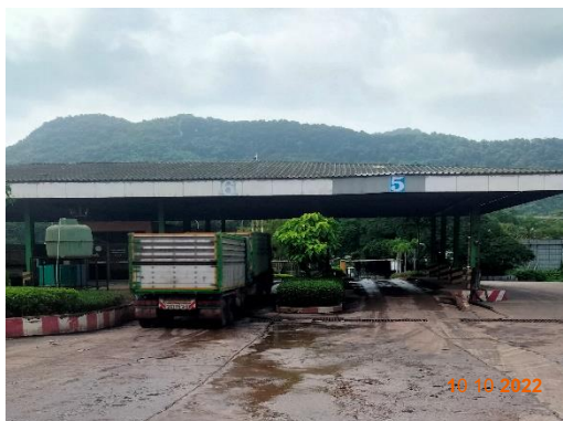
รูปที่ 2-18 เครื่องขังน้ำหนักบริเวณประตูที่ 3

โครงการเหมืองแร่หินอุตสาหกรรมชนิดหินปูน เพื่ออุตสาหกรรมปูนซีเมนต์ สำหรับแปลงคำขอประทานบัตรที่ 12/2556 ร่วมแผนผังโครงการทำเหมืองเดียวกัน กับคำขอประทานบัตรที่ 13/2556, คำขอประทานบัตรที่ 14/2556, คำขอประทานบัตรที่ 15/2556, คำขอประทานบัตรที่ 16/2556 และคำขอประทานบัตรที่ 17/2556 และประทานบัตรที่ 27340/14390 ประทานบัตรที่ 27341/14391 และประทานบัตรที่ 27348/14392 ของบริษัท ทีพีโอ โพลีน จำกัด (มหาชน) ระหว่างเดือนกรกฎาคม-ธันวาคม พ.ศ. 2565