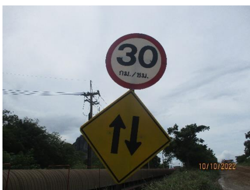
รูปที่ 2-16 ป้ายกำหนดความเร็วของยานพาหนะ ในพื้นที่โครงการ ไม่เกิน 30 กม./ชม.