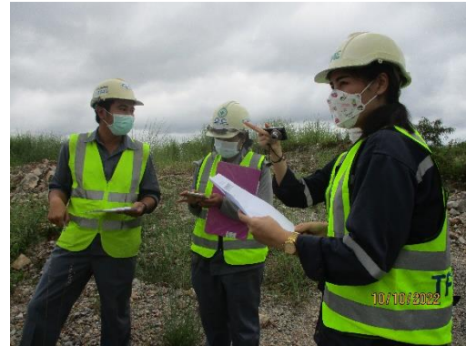
รูปที่ 2-2 การติดตามตรวจสอบตามมาตรการ ป้องกันและแก้ไขผลกระทบสิ่งแวดล้อม